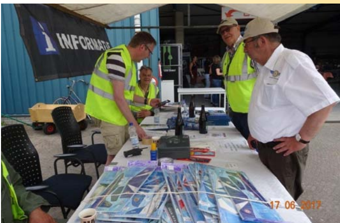
De groep voor de Vliegclub Seppe, aan de lunch in de Cockpit en op de Fly In.