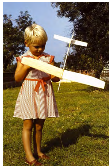
Met mijn eerste, eigen modelzweefvliegtuigje, lente 1978.

IFFR, Rotary en luchtvaart. Het is er bij mij, weliswaar in omgekeerde volgorde, met de papelepel in gegoten. Al van kinds af werden zowel mijn broer als ikzelf door onze vader, Gust Witvrouwen, omringd en ondergedom-