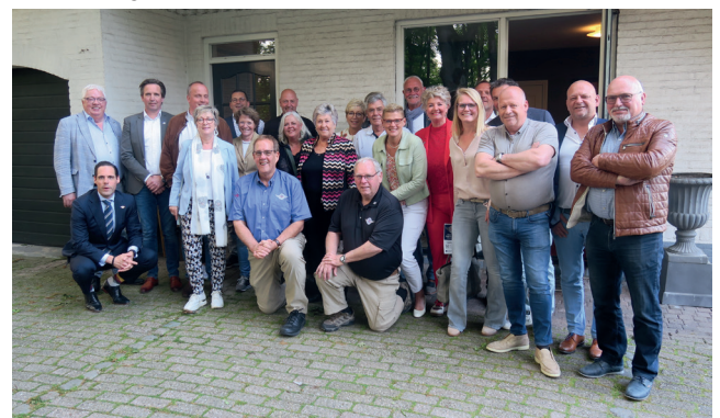
Rotary Club Halderberge-Seppe na de presentatie..